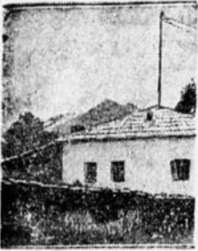
Недавно выстроенная новая школа в Туллаханском селении (Сванетия).