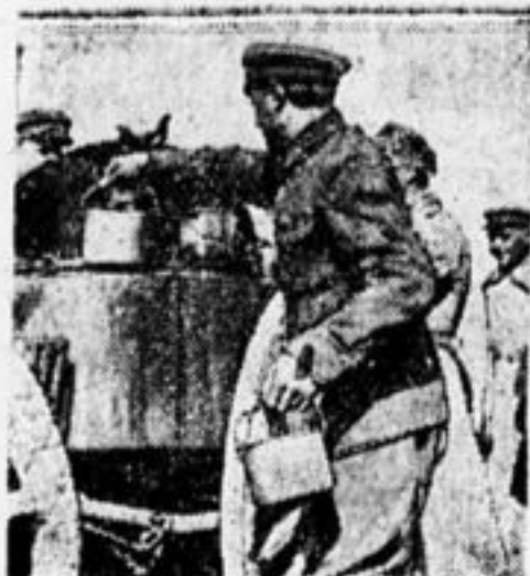
Быт ОДВА. Красноармейцы пришли и походной кухне.