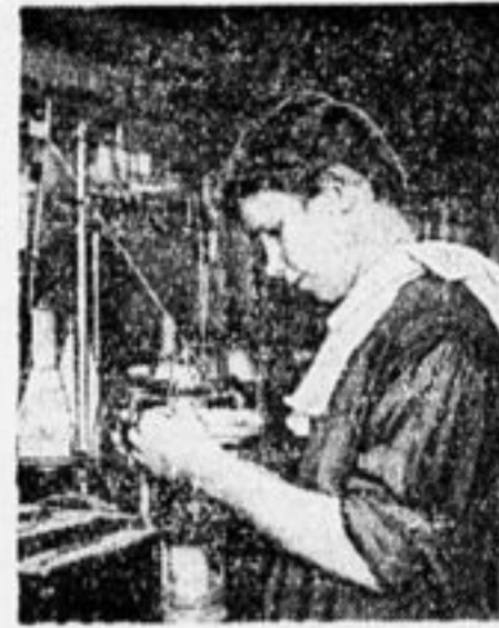
Ударница на фабрике им. Ногина.