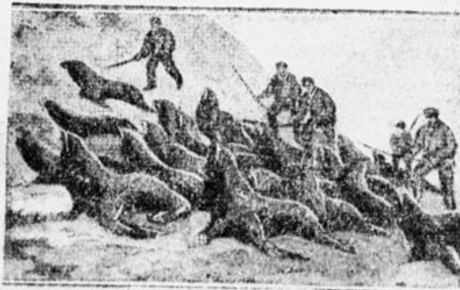
Бой котиков на лебдице.

Остров Медный около Камчатки обладает единственным в мире местом, где еще водится голубая лисица — песец. В других местах Камчатского района ежегодно охотники вылавливают до 100 тысяч котиков. В последнее время начало замечаться вымирание такого дорогого зверя, как котик, соболь, песец, олень и другие.