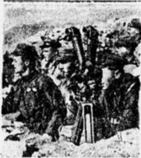
Боевая жизнь ОДВА. На наблюдательном пункте.

* 5-я группа «Б» 20-й школы СОНО собирает деньги для советских ребят на К.-В. ж. д. и вызвала другие группы.